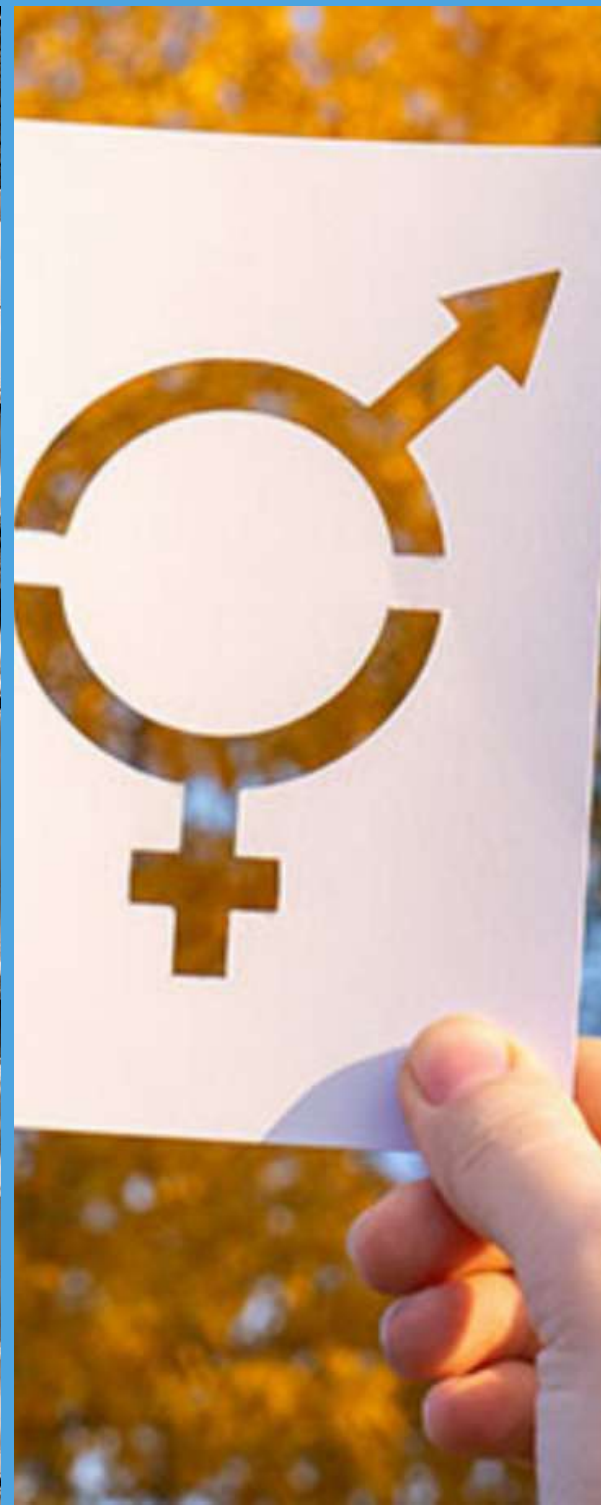
Consultoría de Igualdad