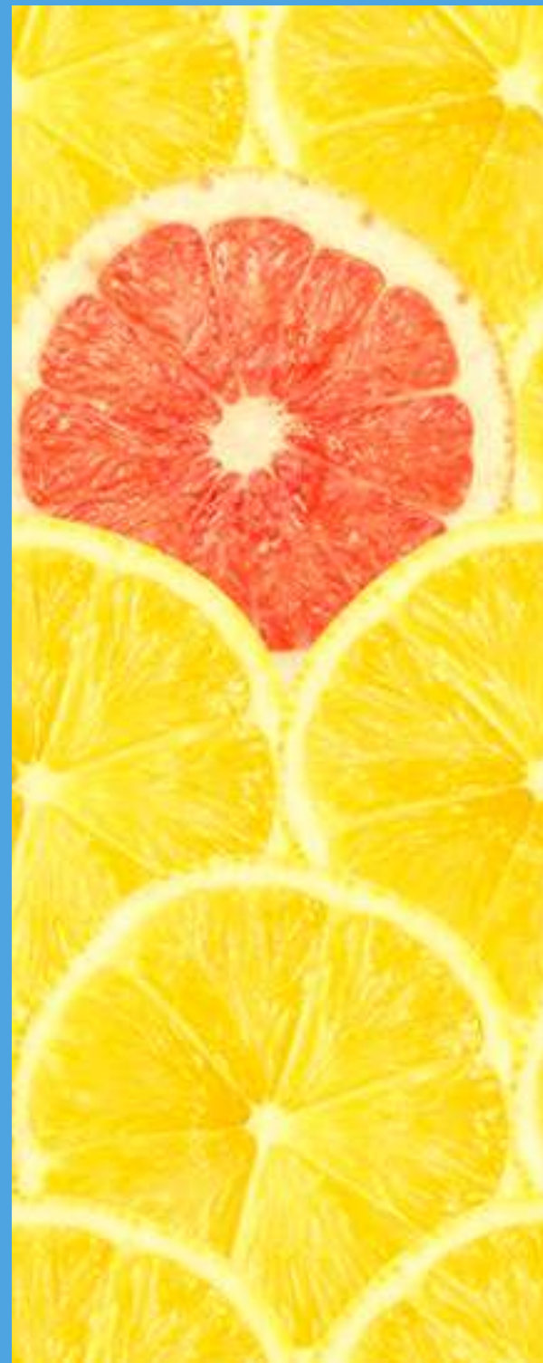
Selección de Personal

La respuesta que necesites en cada momento y en todos los ámbitos relacionados con la gestión de personas.