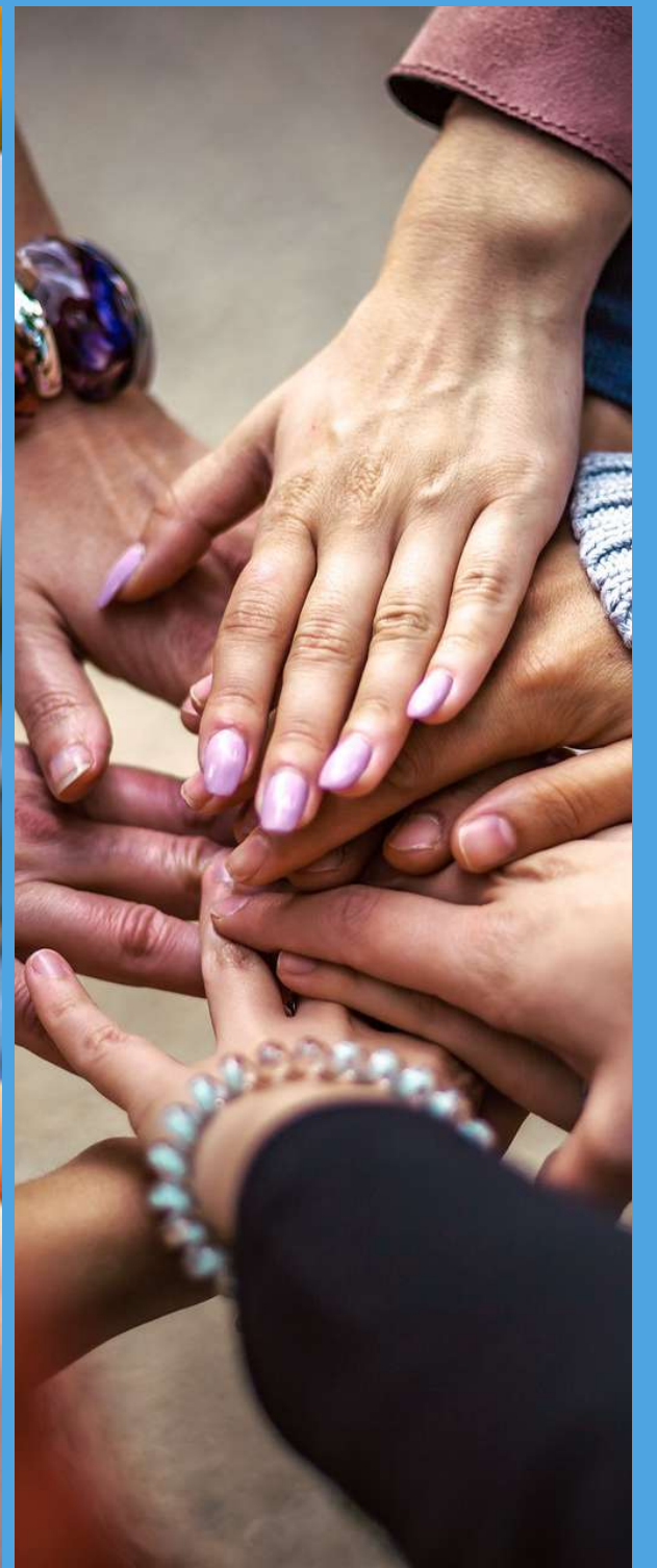
Consultoría de RRHH